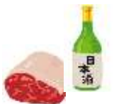
地域産品 販売促進費