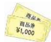
プレミアム付商品券・金券等