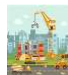
施設整備（ハード事業）