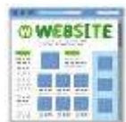
ポータルサイト 制作費